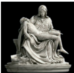
“La Piedad” de Miguel Ángel y “Michael Jackson and bubbles” de Jeff Koons.